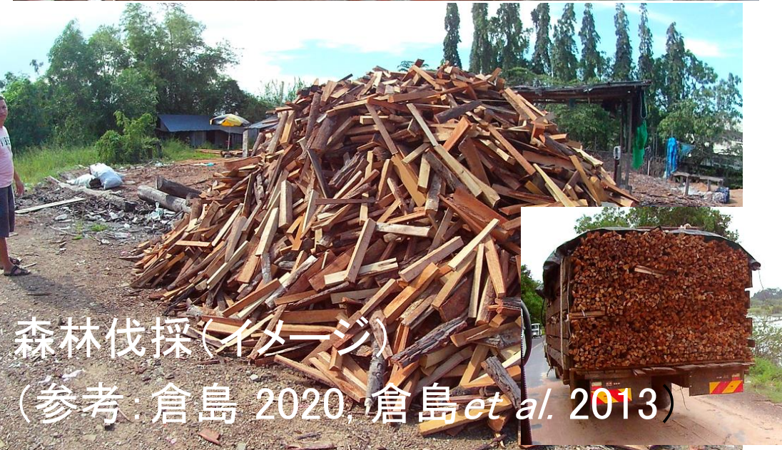
森林伐採(イメージ) (参考: 倉島 2020, 倉島 et al. 2013)