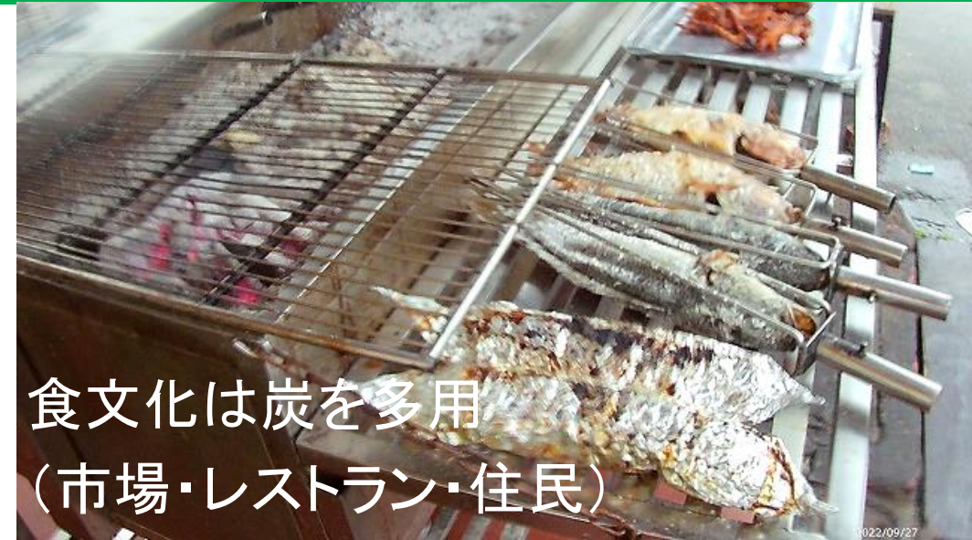
食文化は炭を多用 (市場・レストラン・住民)