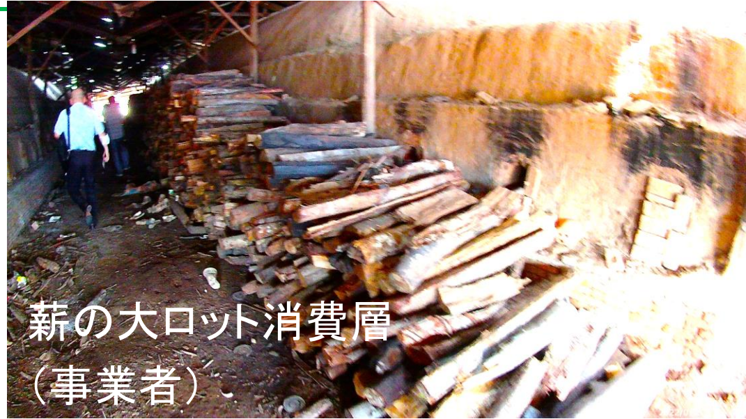
薪の大ロット消費層 (事業者)