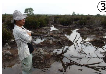
過湿で酸素が少ない湿地