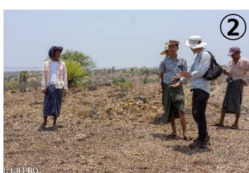
降雨が安定しない乾燥地