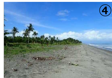
保湿性に乏しい海岸砂浜