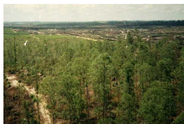
ユーカリ植林（湿潤熱帯）

注）植林木が成長している期間における推計。植林木を伐採した場合は、それまでに吸収したCO 2 が再放出される。