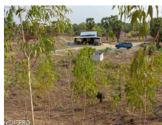
ユーカリ植林（乾燥地）