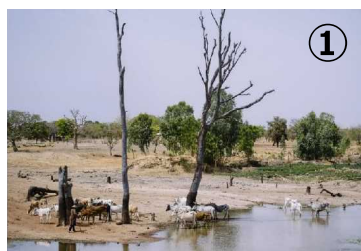
放牧による劣化荒廃地