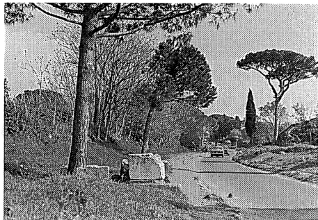
写真-2 アッピア街道（旧道）