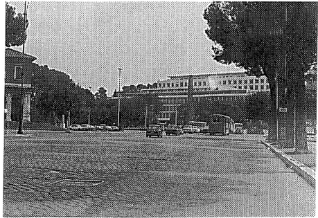
写真-1 FAO 本部本館（旧イタリア植民地省）

FAO地域事務所はチャオ・プラヤの畔にあり鉄筋コンクリート造りの新館と木造の旧館から成り、我々の林業プロジェクトは旧館の2階の一角を占有していた。かっ