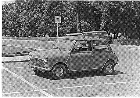
写真-4 オースチン・ミニクーパー 1000

とカロリーの補給で、レストランの窓から表の通りの様子を眺めつつコップを傾けるしばしの休息。それから部屋へ戻って着替えて外へ出る。タクシーをつかまえ、秘書に教えてもらったタイ語で行先を告げ値段交渉成立して乗り込む。行先はアイス・スケートリンクである。というのは、たまたま部屋でテレビを観ていたらリンクの広告が目にとまった。そこでフロント