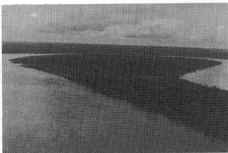
写真-1 雨季のアマゾン河イキトス市附近

樹種の分布には偏りがみられる。森林の総蓄積は40億 m^3 に達するとみられ、その成長量4,500万 m^3 が伐採可能量とされているが、1986年の統計上の伐採量は他地方を含めてもその2割に当たる842万 m^3 と少ないものとなっており、現在、Caoba ( Swietenia macrophylla ), Cedro ( Cedrela odorata ), Ishipingo ( Amburana cearensis ), Tornillo ( Cedrelinga catenaeformis ) 等に代表される商業樹種として一般的に利用されているものは約30種程度でしかなく、その蓄積は、条件の良い場所でもha当たり30 m^3 程度、普通では5 m^3 程度とみられ、資源の一部しか利用していない状況にある(写真-1)。