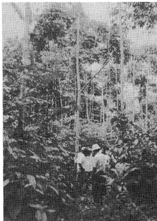
写真-2 Tornillo 天然更新 7 年生 (間伐後)

保育についてみると、通年高温多湿な気候下で植物の成長が旺盛であるので、更新の成否は保育の如何に関わっており、保育の着実な実行が欠かせない。保育の基準は一部の早生樹種を除いて未だ確立していないが、10 m の列幅を全刈りする下刈の回数のおよその目安は、更新木の樹高 3 m までは年に 2-3 回、3-5 m の間は 1-2 回であり、このほかつる切り、除伐及び上空を覆うを中高木を除く受光量調節の作業も必要である。熱帯広葉樹の造林は、絶え間ない他植生の繁茂との戦いを勝ち抜くことによって成功に導かれるのである。