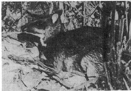
写真-6 ナプマメジカ：ウサギほどの小さなシカ