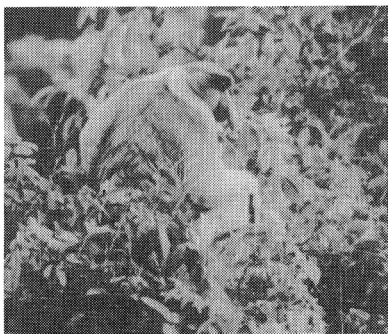
写真-1 テングザル：ボルネオ島固有のサルで川沿いの森にすむ

固いうろこで全身をおおい敵に襲われると丸くなって身を守るセンザンコウ、ムササビと同様に夜の森を滑空するヒョケザル、ムーンラットというネコの大きさ程もある真白なモグラ、全身を鋭い針で包んだヤマアラシの仲間など一風変わった動物も多く、姿や形、生活様式の違いなどに多様性が感じられる。