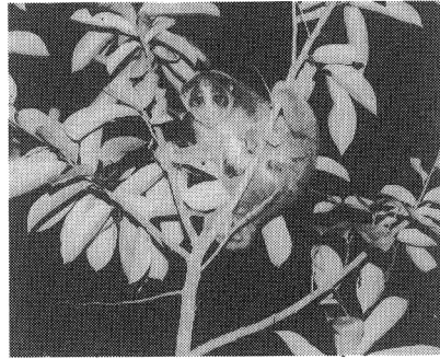
写真-5 スローロリス：夜行性の原始的なサル

さらに動物に関しては野ばなしである。警察、森林警察も動物に関しては捕えようが殺そうが何ともがめない。保護林だからスイロク、キョン、マメジカがよく捕れるのである。ワナは動物を選ばないから食用としないシベット、ヤマネコ、サルも捕まる。それらはペットとしても遊ばれるか、現場で殺されて捨てられる。それにイヌ、イエネコの野生化もめだつ。イヌはオオカミと同じで群れを作り昼夜を問わず動物を狩っている。私の手許にあるシベット、ヤマアラシ、イノシシなどの標本は、そうい