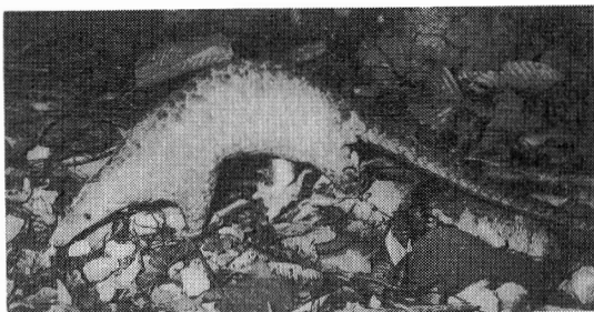
写真-4 マライセンザンコウ：ウロコのできた固いよろいで身をかためている