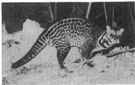
写真-2 マレーシベット：もっともよくみられる肉食動物

そ小さいが高木でうっそうとした森林もあるし、耕作地に近い明るい林、人々の生活の中にある屋敷林や果樹の植栽も見られる。動物もそういったそれぞれの所に対応した種類があるようだ。例えばミューラーテナガザル、クリイロリーフモンキー、オオリス、ピグミーリス、マレーグマ、ウンピョウ、マーブルドキャット、スイロク（大形のシカ）、キョンなどは樹冠がうっぺいした高木林でしか住めないか、または好んでそのような林で生活する。同じく森林に住む動物でもアカオツパイ、マライセンザンコウ、ジムヌラ、ミケリス、マライパームシベットなどは比較的明るい背の低い林に多い。ヒゲイノシシ、マレーシベット、チピオマンガース、ヤマアラシの仲間、オオアカムササビなどはどちらの森林でも見られる。カニクイザル、シルバーリーフモンキー、テングザルは、ほとんど川沿いの林にしか住まないし、プランテインリスは人家の庭先や耕作地にある小さな林にのみ住み、山中ではまず見られない。このようなことが結果的に種類数を多くしているのだろう。ただし、これは動物の数が多いということとは別で、カニクイザルやブタオザルを見ると、群れを構成している個体数が他の地域に比べて少ないし、ここに分布する群れの数そのものが少なく感じられる。マレーグマ、ウンピョウに至っては、ごくまれに足跡が見つかったり、数年に1度は密猟者に捕まったりはするが、270 km 2