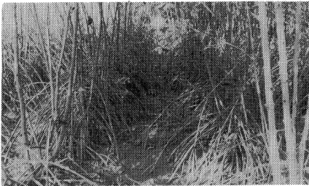
写真-3 Rhizophora apiculata の人工造林地 12年生で樹高 14-18 m, 胸高直径 12-20 cm に達する好成绩地の例(1988年8月撮影)。

影をとどめるにすぎなくなってしまう。汽水性の沼沢湖セガル・アナカンにはカンボン・ラウト(海の村)とよばれる集落がある。かつて湖の上に杭上家屋をたてて住んでいた。近年沼沢湖の陸化がすすみ水上家屋が陸上家屋化しつつある。海の村という呼び名も別の名におきかえられようとしている。上流域の開発が沿岸域に影響をおよぼした例である。生活は依然としてエビ・カニ・魚を対象とする漁民である。漁具としてマングローブ林の小径木(直径4~5 cm, 長さ4~6 m)を大量に消費する。 Rhizophora spp., Bruguiera spp. が好んで利用される。漁獲量がおちると薪を切って町へ売りにいく。漁獲量が減ったのはマングローブ林が減ったためだというが、薪取りによって、さらにマングローブ林の減少に拍車がかかる。いったんできあがった町との交流ルートは、マングローブの需要を増やすことはあっても減らすことはない。