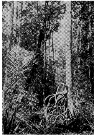
写真-1 東インドネシア・ハルマヘラ島のマングローブ林、最大樹高 39 m 胸高直径 51 cm という大型の林分である (1986年9月)。

タイのマングローブ林は大陸部の特徴も、島嶼部の特徴もそなえている。表-2にみるとおり、経年的な面積データが発表されている。年度によって面積算出の方法が