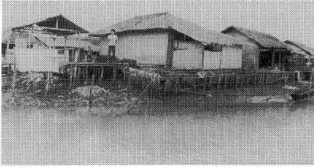
写真-2 中部ジャワ南岸チラチャップに近いカンボン・ラウト(海の村)かつて杭上家屋が沼沢湖セガル・アナカンにたっていたが、陸地化しようとしている(1988年8月撮影)。