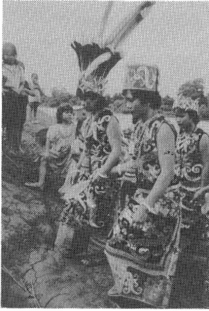
写真-1 村の女性に手を引かれて ゆく新婦（向こう側）