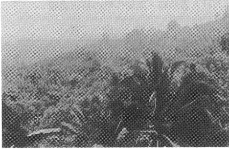
写真-1 北スラベシ Tongkunai のチョウジの集団産地

料のショウズク (Cardamon), コーラの原料のコラ (Cola), 食料品の香味料に用いられるオールスパイス (Allspice), 香辛そ菜のウイキョウ (Fennel) やクミン (Cumin), 香辛料のコエンドロ (Coriander), 香辛料のほか薬用にも用いられるショウガ (Ginger) やガランガル (Greater galangal) などがある。