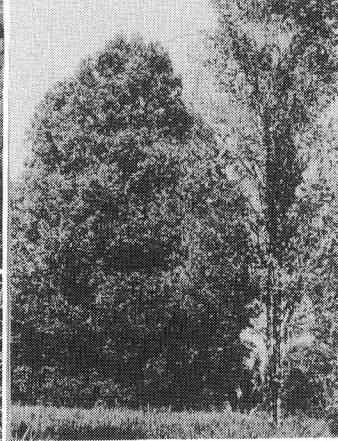
写真-2 (左上): チョウジ Leaf fall 病の激発地 (北スラベシ, Tanahwangko) 写真-3 (左下): チョウジ CDC 病による枝枯れ症状 写真-4 (右): チョウジ CDC 病の品種間差異

はバナナの Wilt 病の P. solanacearum との異同が検討されている。被害は西スマトラ中心にスマトラ全域におよび、西部ジャワ、中部ジャワへと広がっており、被害面積 6,700 ha (面積率 1.1%) (1983-1874 年統計 3) ) とされている。ヨコバイ、アワフキ類の昆虫によって媒介されるとされ、その防除法が検討されている。一方、直接細菌をおさえる方法として、抗生物質の樹体内注入が検討され、オキシテトラサイクリンの 6,000 ppm 液を 3 か月毎に、被害樹 1 本当たり 500 ml の注入で被害樹がほとんど回復するという結果が得られている。耐病性品種の探索もなされたが実用的なものは見つかっていない。